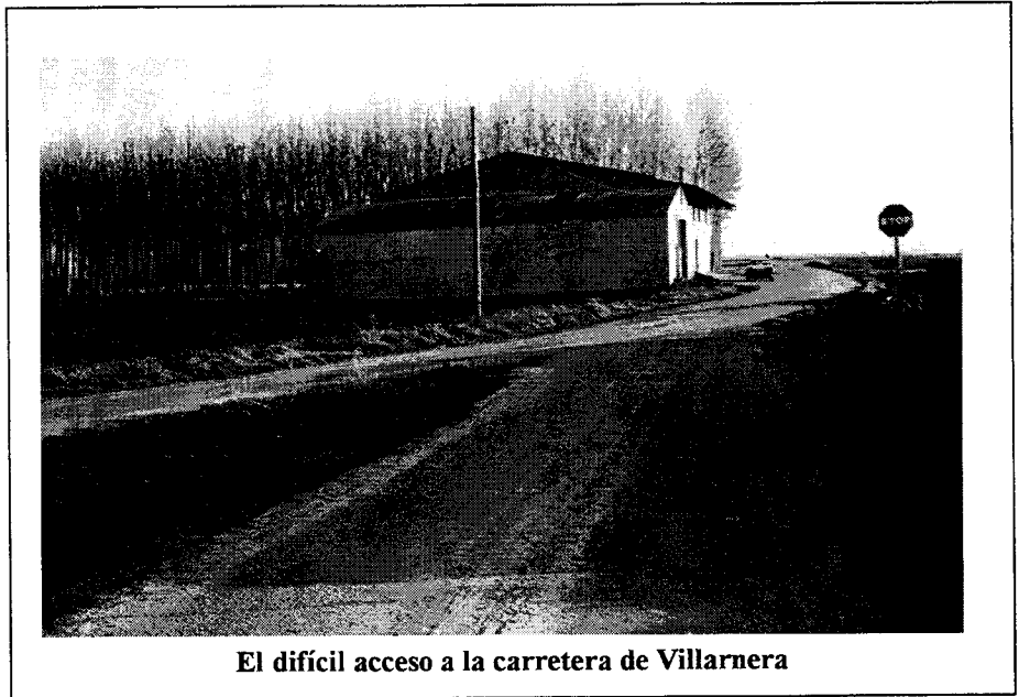
El difícil acceso a la carretera de Villarnera

Estos datos son los referidos únicamente a las ayudas concedidas al amparo del Real Decreto 1887/91 de 30 de diciembre sobre «Modernización para la Eficacia de las Explotaciones Familiares Agrarias».