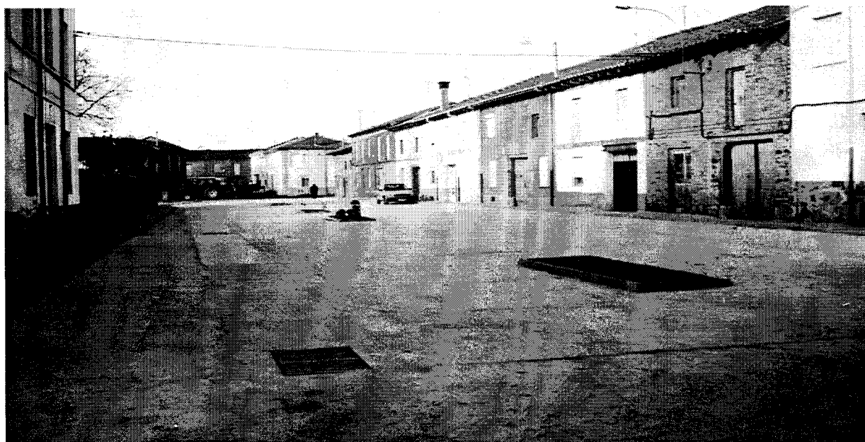
Calle Recodo. "8ª fase"

El 14 de marzo la Junta Vecinal se encarga de plantar los cipreses del cementerio. A mediados de abril se colocan tubos en varios sitios que facilitan el paso, tanto de agua como de vehículos, en zonas aledañas a las plantaciones. El 11 de abril se siembra de hierba la plaza, esa que seguimos sin poder llamar con un nombre. El 29 de abril las señoras que habitualmente se encargan de cuidar la plaza del pilar , preparan la elipse del centro y siembran la hierba. Los días 7 y 9 de diciembre la "empresa" del paseo deja limpia de piedras y traviesas la zona que ocupaban. La plaza parece otra. Ya iba siendo hora.