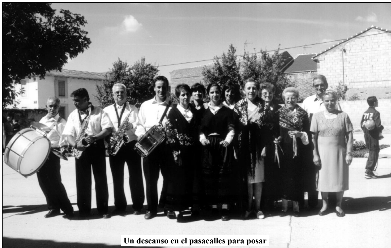
Un descanso en el pasacalles para posar

El título de Condestable de los Reinos de León y Galicia , bastante desconocido, fue objeto de un estudio en el s. XVIII a cargo de Juan Dávila Quesada. Se trata de uno de los muchos cargos medievales comunes a todos los territorios de la Corona de León, y que con frecuencia en su título señalaban a las dos principales circunscripciones: Reino de León y Galicia.