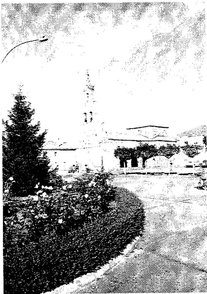
Día de sol en la plaza.

mo no sea inferior al 3%. Por lo tanto, la ayuda por parte de la Administración como bonificación de interés será, para este año de 1996, del 6%, ya que el interés preferencial fijado es del 9%. Este interés preferencial se modificará según la fluctuación de los intereses en los mercados bancarios.