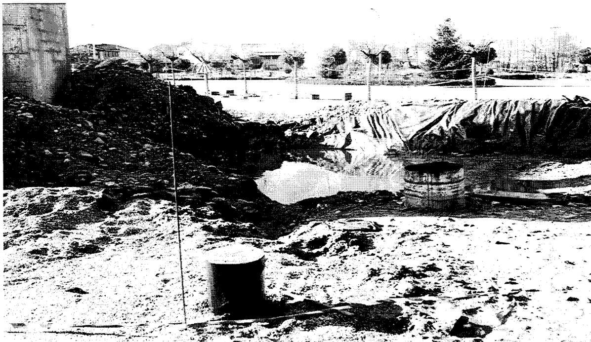
Las obras del sondeo.