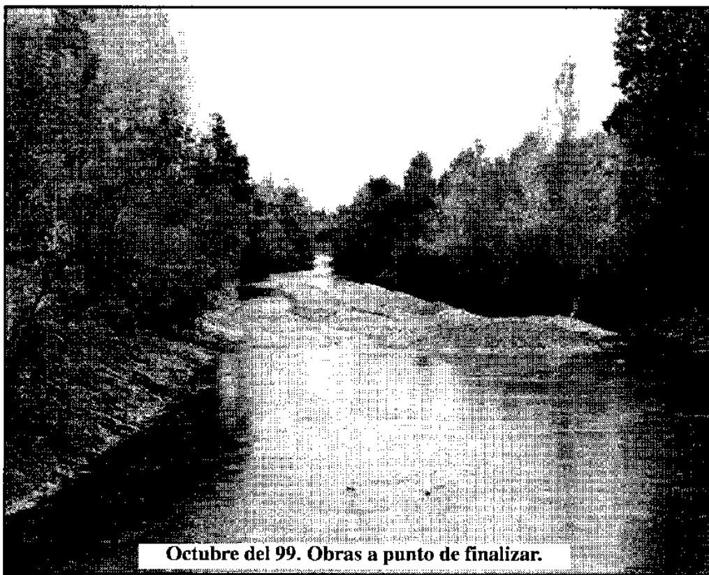
Octubre del 99. Obras a punto de finalizar.

Dejamos Salardú y comenzamos a subir el puerto de La Bonaigua, de primera categoría. Tuvimos niebla en un principio, que nos impidió contemplar el paisaje, pero a medida que subíamos la niebla desapareció y todo va muy bien. Nos presentamos en el puerto de más altitud (2.070 m.), donde vimos dos grandes manadas de ganado: una de vacuno y otra, no muy lejos, de yeguas con sus crías, y, como es lógico, había también una línea de telesilla para ir a la estación de esquí de Baqueira Beret, que se encontraba muy cerca