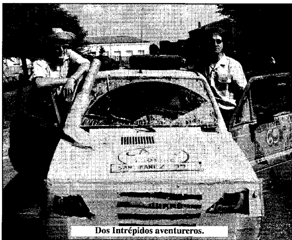
Dos Intrépidos aventureros.

Saliendo de Ainsa vemos un indicador que dice: Plan, veintitantos kilómetros. Seguimos pasando por los pueblos y nos hace gracia el nombre de uno de ellos: La Cabezonada. Siguiendo, pasamos una garganta llamada Congosto del Ventanillo. Impresionante. Aunque tiene mucha vegetación,